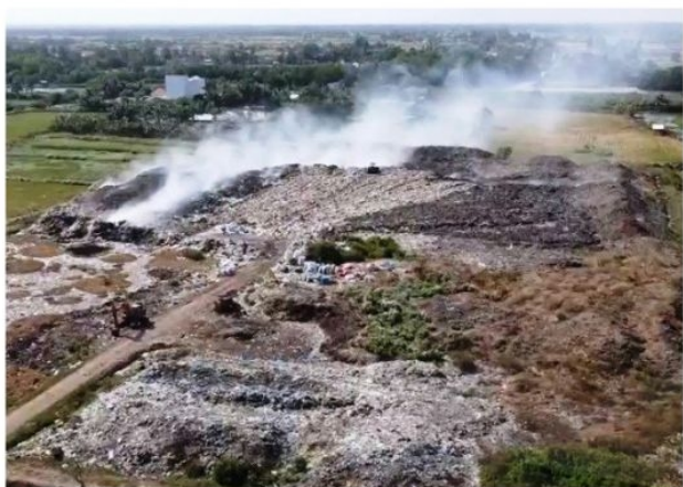
Hình 1. Đốt rác lộ thiên gây ô nhiễm môi trường (Theo Bản tin của Ban Thời sự, Đài Truyền hình Việt Nam, ngày 14/4/2021)

(Theo bài viết Việt Nam nằm trong số 20 quốc gia có lượng rác thải lớn nhất và cao hơn mức trung bình của thế giới , Tạp chí điện tử Ban Tuyên giáo Trung ương, ngày 18/10/2021)