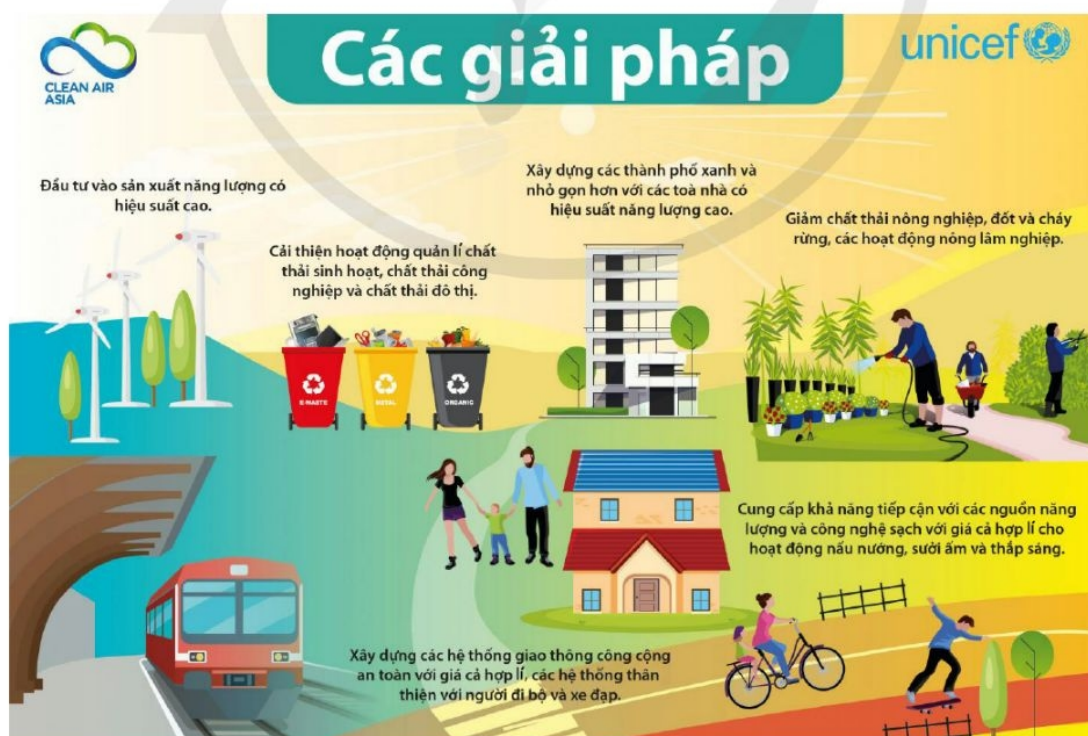
Hình 1. Các giải pháp khắc phục ô nhiễm môi trường (Theo UNICEF Việt Nam, unicef.org/vietnam , ngày 09/5/2019)

Em hãy quan sát hình ảnh, đọc thông tin và trả lời câu hỏi