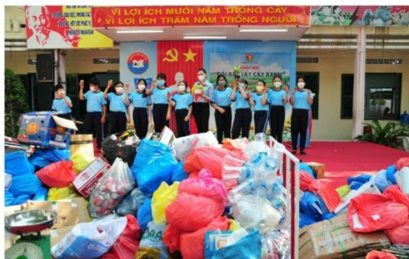
Hình 2. Học sinh tham gia ngày hội đổi rác lấy cây xanh

Thông tin. Sau hơn một năm thực hiện phong trào hạn chế rác thải nhựa, Bộ Tài nguyên và Môi trường đã tổ chức Hội nghị đánh giá kết quả thực hiện Phong trào chống rác thải nhựa. Báo cáo cho thấy, nhận thức của người dân, cộng đồng và doanh nghiệp đã được nâng cao hơn rất nhiều, bước đầu đã có giải pháp, sản phẩm thay thế cho túi ni-lông khó phân huỷ và nhựa sử dụng một lần. Các doanh nghiệp đã hưởng ứng chống rác thải nhựa bằng những hành động cụ thể, từ đó giảm thiểu được hàng tấn ni-lông ra môi trường. Người tiêu dùng dần thay thế túi ni-lông bằng gói hàng bằng lá chuối, lá sen trong sinh hoạt hằng ngày. Đặc biệt, cấp uỷ, chính quyền địa phương đã vào cuộc quyết liệt, ban hành nhiều kế hoạch phòng chống rác thải nhựa, triển khai đến cấp cơ sở, góp phần chung tay giảm thiểu rác thải nhựa, bảo vệ môi trường.