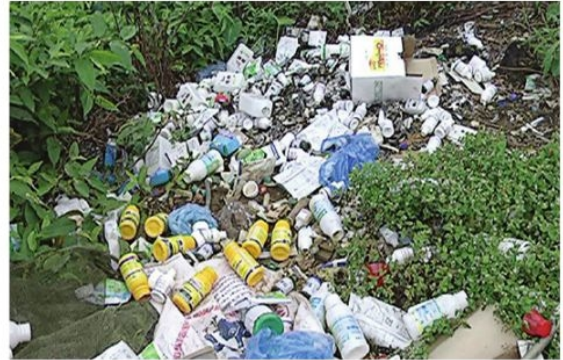
Hình 1. Vỏ thuốc bảo vệ thực vật do người dân vứt bỏ

Thông tin 1. Ô nhiễm môi trường từ sản xuất nông nghiệp ở Việt Nam những năm gần đây luôn ở mức báo động. Hàng chục triệu tấn chất thải chăn nuôi, chất thải trồng trọt đang ngày ngày xả ra môi trường. Bên cạnh đó, để có năng suất, môi trường đất và nước đang phải gánh chịu hàng nghìn tấn phân hoá học, thuốc trừ sâu đổ xuống mà tỉ lệ hấp thụ chỉ khoảng 40%.