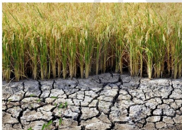
(Theo bài báo Cà Mau công bố tình hình khẩn cấp hạn hán cấp độ 2, Báo điện tử Đảng Cộng sản Việt Nam, ngày 03/3/2020)

Em hãy quan sát hình ảnh, đọc thông tin và trả lời câu hỏi