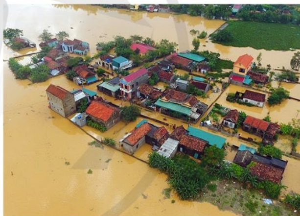
(Theo bài báo Tập trung khắc phục hậu quả mưa lũ tại các tỉnh miền Trung, Báo điện tử Hải quân Việt Nam, ngày 17/10/2016)

Thông tin 1. Trên khắp thế giới, hằng năm, hơn 90% người dân phải tiếp xúc với nồng độ những hạt bụi mịn ngoài trời cao hơn các chỉ tiêu về chất lượng không khí WHO đưa ra. Ô nhiễm không khí có liên quan tới khoảng 7 triệu ca tử vong sớm mỗi năm. Ở Việt Nam, với sự phát triển của một số lĩnh vực như công nghiệp, vận tải, tình trạng ô nhiễm không khí ngày càng nghiêm trọng và số người tử vong sớm có liên quan tới ô nhiễm không khí ngày càng gia tăng. Chính những nguyên nhân trên đã ảnh hưởng trực tiếp và gián tiếp đến chất lượng cuộc sống (sức khỏe, giáo dục, y tế,...), gây thiệt hại về kinh tế và bất ổn xã hội. Cụ thể: