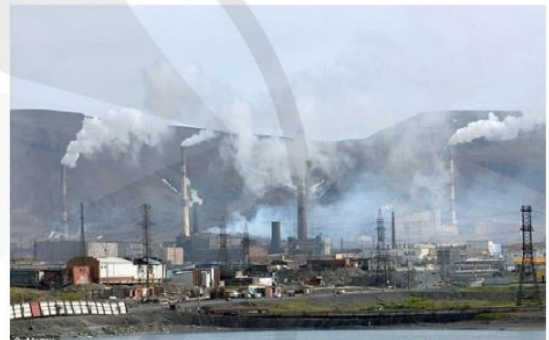
Hình 2. Nguy cơ ô nhiễm môi trường từ các khu công nghiệp

Thông tin 2. Tính đến cuối năm 2020, trên phạm vi cả nước có 369 khu công nghiệp được thành lập với tổng diện tích khoảng 114 nghìn héc-ta. Nhiều dự án, cơ sở hiện đang đầu tư, vận hành tại các khu công nghiệp gây ô nhiễm môi trường nghiêm trọng như: luyện kim, khai thác khoáng sản, phá dỡ tàu biển, sản xuất giấy, bột giấy, dệt nhuộm, lọc hoá dầu, nhiệt điện, sản xuất 698 cụm công nghiệp đi vào hoạt động.