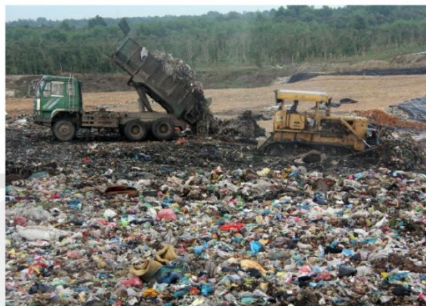
Hình 2. Bãi chôn lấp chất thải

Thông tin 2. Nhiều khu công nghiệp ở nước ta, do sử dụng công nghệ lạc hậu đã làm phát sinh nhiều chất ô nhiễm. Sự lạc hậu về công nghệ dẫn đến việc gia tăng mức độ tiêu thụ nguyên liệu và năng lượng hơn, phát sinh nhiều chất thải hơn, gây sức ép đối với môi trường. Trong khai thác khoáng sản, việc quá chú trọng đến sản lượng khai thác, chưa quan tâm nhiều đến sử dụng công nghệ đã làm gia tăng mức độ ô nhiễm và gây lãng phí tài nguyên thiên nhiên. Ô nhiễm môi trường tại một số làng nghề còn có xu hướng gia tăng, nguyên nhân chính là công nghệ sản xuất lạc hậu, lại chưa đầu tư cho hoạt động xử lý chất thải. Ô nhiễm môi trường tại các làng nghề chủ yếu là ô nhiễm bụi, khí độc, hơi kim loại, mùi và tiếng ồn, tùy thuộc vào tính chất, quy mô và sản phẩm của từng loại ngành nghề.